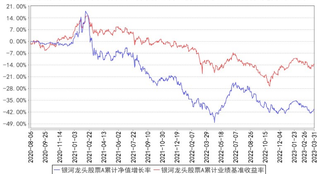
银河龙头股票A累计净值增长率与同期业绩比较基准收益率的历史走势对比图