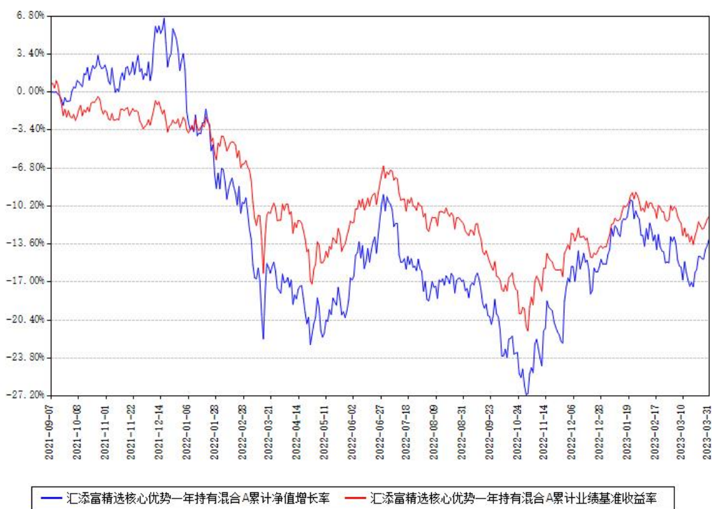
汇添富精选核心优势一年持有混合A累计净值增长率与同期业绩比较基准收益率对比图