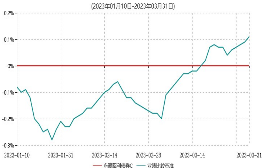
永赢昭利债券C累计净值增长率与业绩比较基准收益率历史走势对比图

注：1、本基金合同生效日为 2023 年 01 月 10 日，截至本报告期末本基金合同生效未 满一年； 2、本基金建仓期为本基金合同生效日起六个月，截至本报告期末，本基金尚处于建仓 期中。