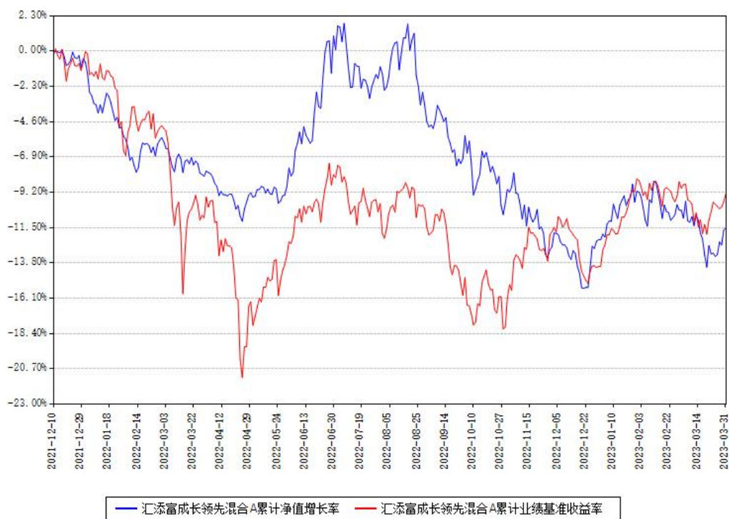
汇添富成长领先混合A累计净值增长率与同期业绩基准收益率对比图