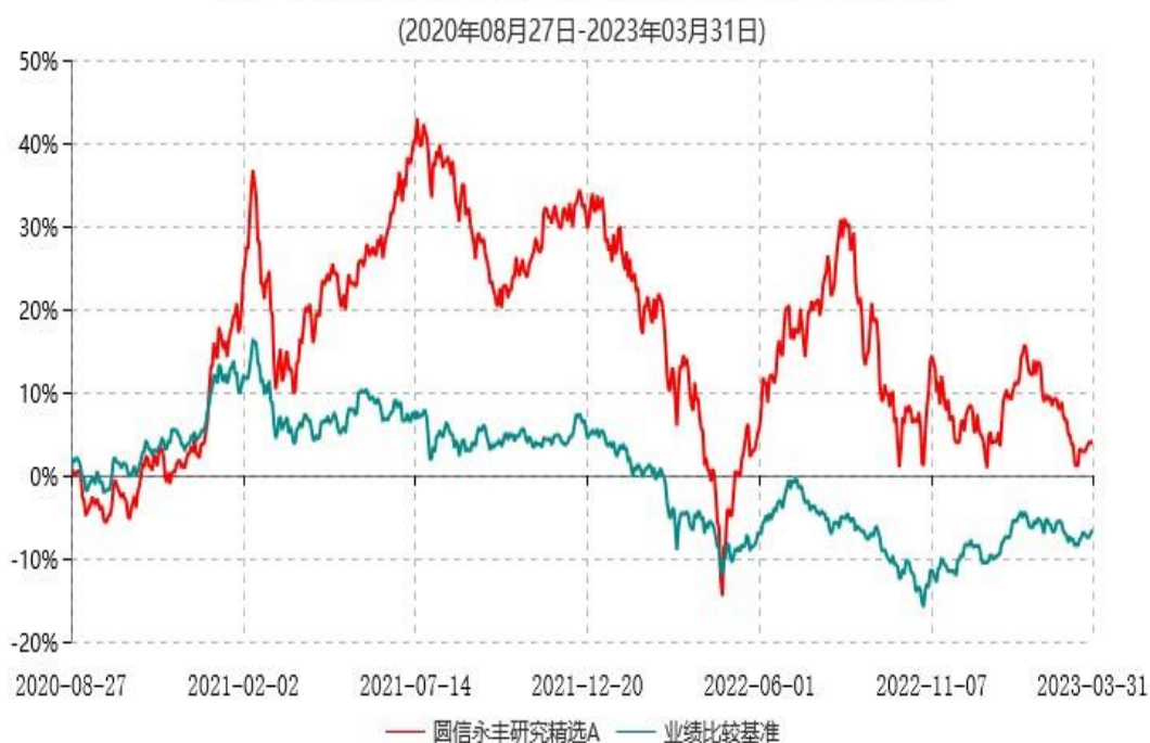
圆信永丰研究精选A累计净值增长率与业绩比较基准收益率历史走势对比图