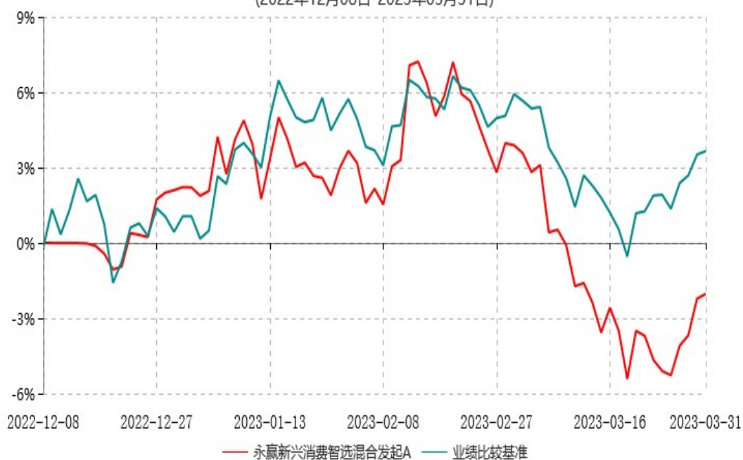
永赢新兴消费智选混合发起A累计净值增长率与业绩比较基准收益率历史走势对比图 (2022年12月08日-2023年03月31日)

注：1、本基金合同生效日为 2022 年 12 月 08 日，截至本报告期末本基金合同生效未 满一年； 2、本基金建仓期为本基金合同生效日起六个月，截至本报告期末，本基金尚处于建仓 期中。