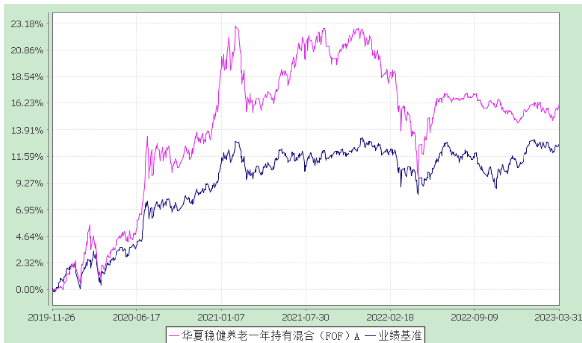
华夏稳健养老一年持有混合（FOF）Y：