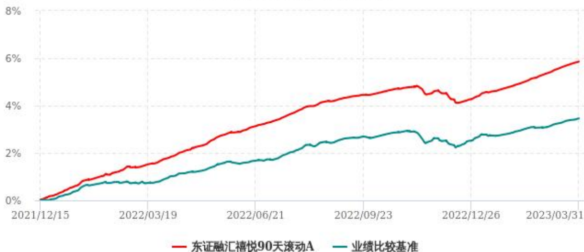
东证融汇禧悦90天滚动C累计净值增长率与业绩比较基准收益率历史走势对比图