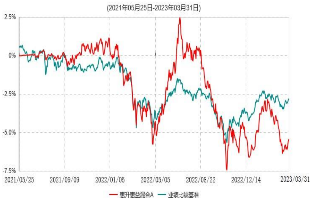
惠升惠益混合A累计净值增长率与业绩比较基准收益率历史走势对比图