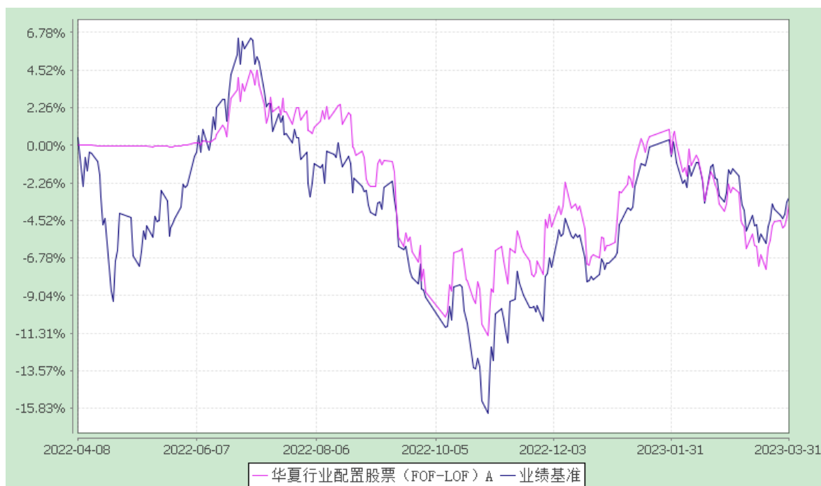
华夏行业配置一年封闭股票 (FOF) C: