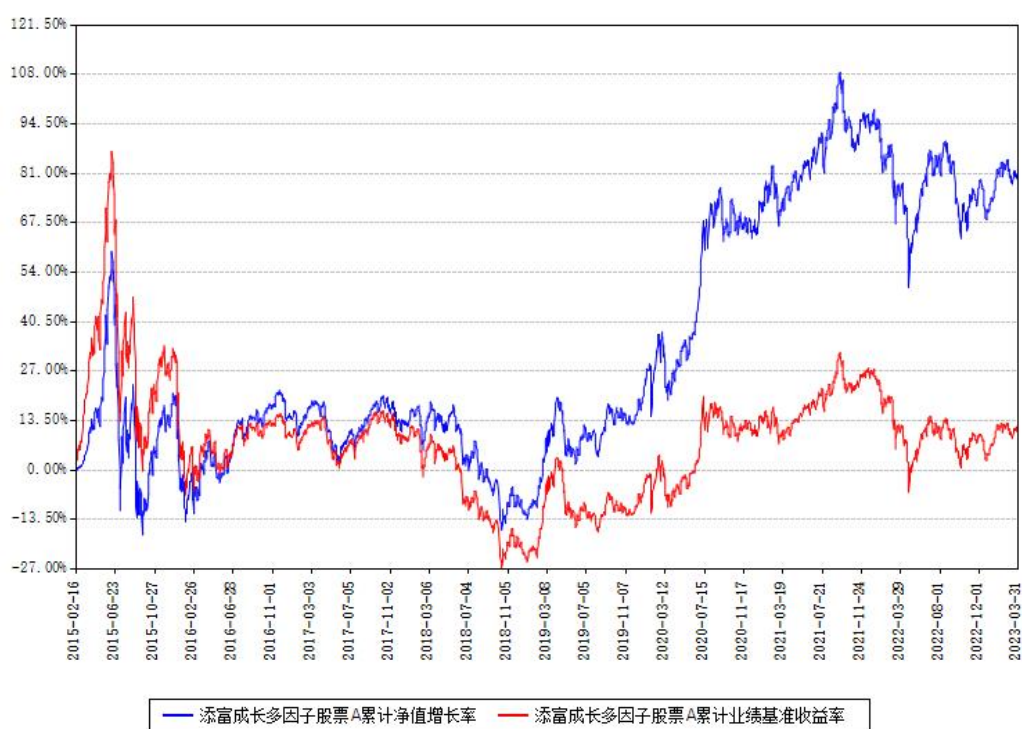
添富成长多因子股票A累计净值增长率与同期业绩基准收益率对比图