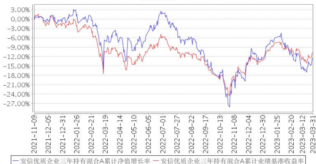
安信优质企业三年持有混合A累计净值增长率与同期业绩比较基准收益率的历史走势对比图