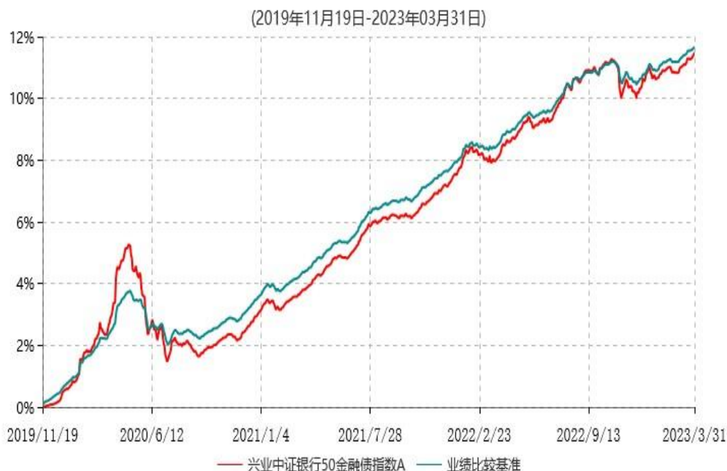
兴业中证银行50金融债指数A累计净值增长率与业绩比较基准收益率历史走势对比图