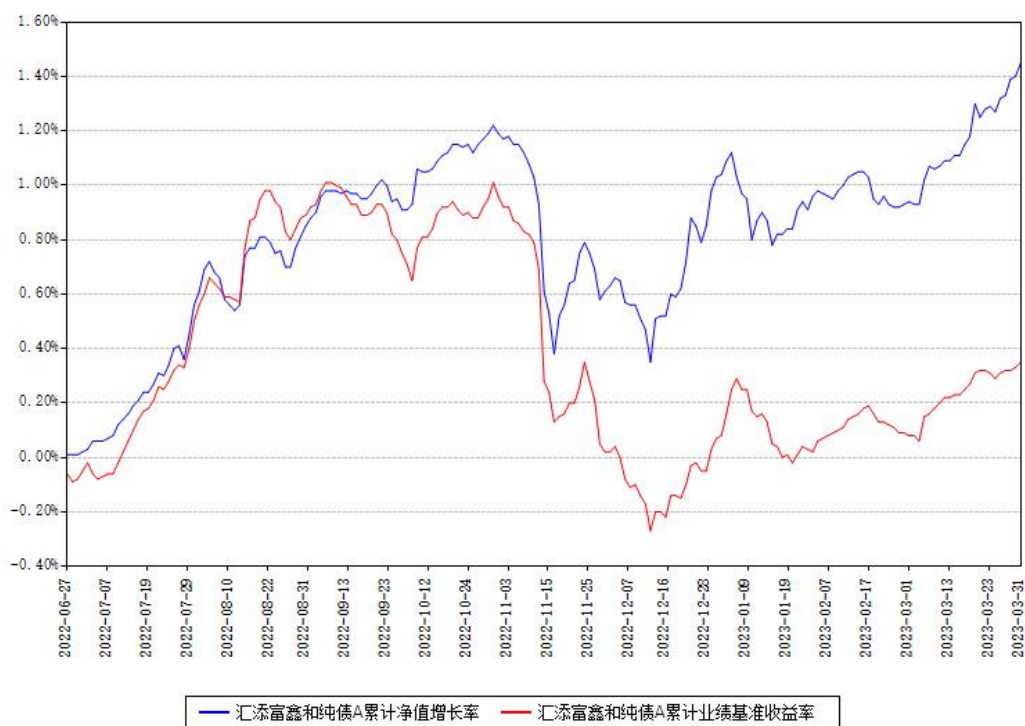
汇添富鑫和纯债A累计净值增长率与同期业绩基准收益率对比图