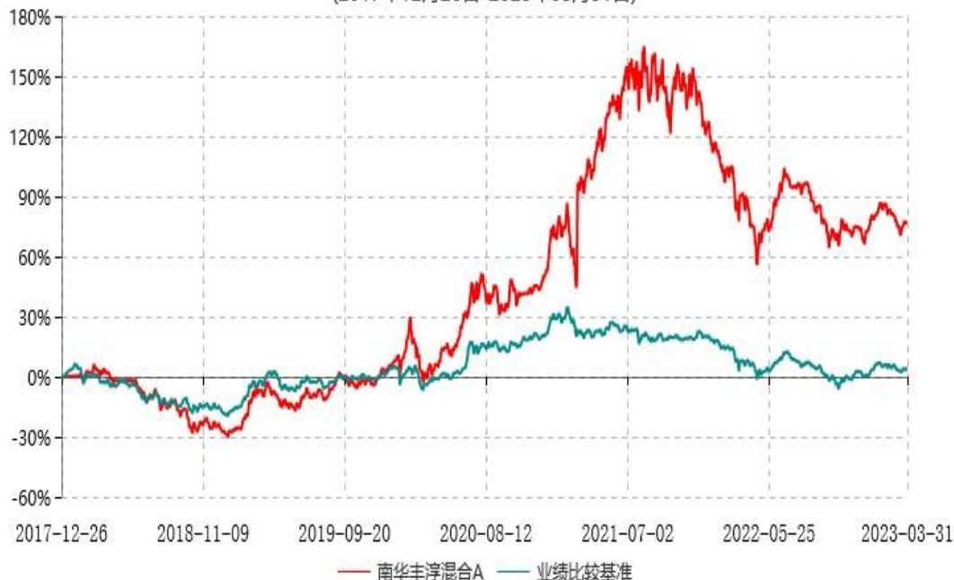
南华丰淳混合C累计净值增长率与业绩比较基准收益率历史走势对比图