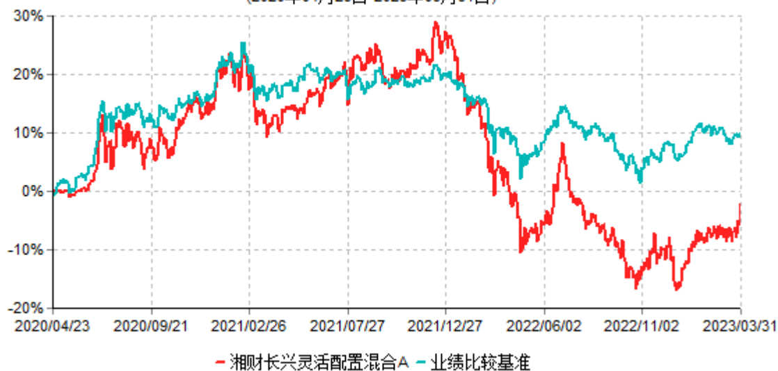
湘财长兴灵活配置混合A累计净值增长率与业绩比较基准收益率历史走势对比图 (2020年04月23日-2023年03月31日)