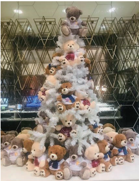
CHEO Bear Tree CHEO 玩具捐贈

Sheraton Ottawa Hotel, Canada 加拿大渥太華喜來登酒店