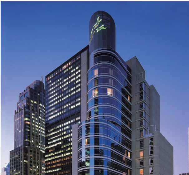
Sotel New York, USA 美國紐約索菲特酒店