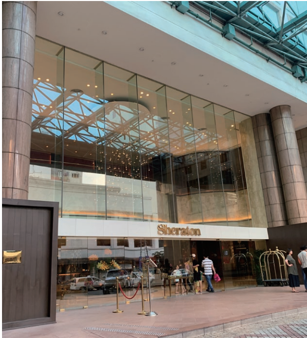
Sheraton Saigon Hotel & Towers, Vietnam 越南胡志明市西貢喜來登酒店