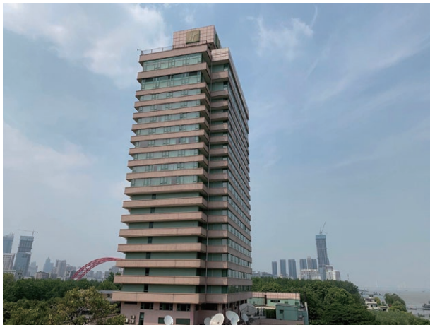
Holiday Inn Wuhan Riverside, China 中國武漢晴川假日酒店