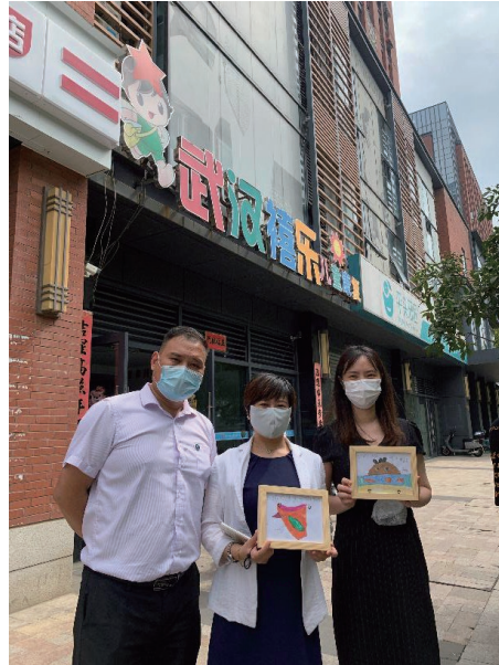
Visit children with mental retardation 探訪兒童