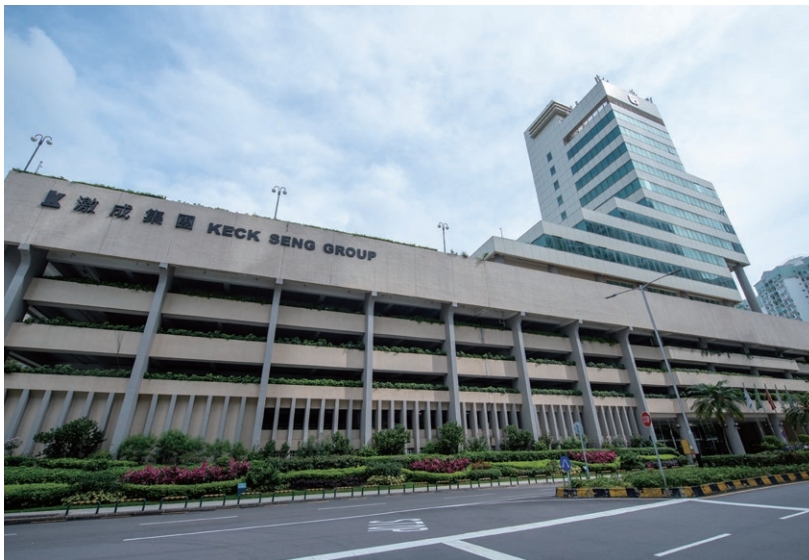
Ocean Tower, Macau 澳門海洋大廈