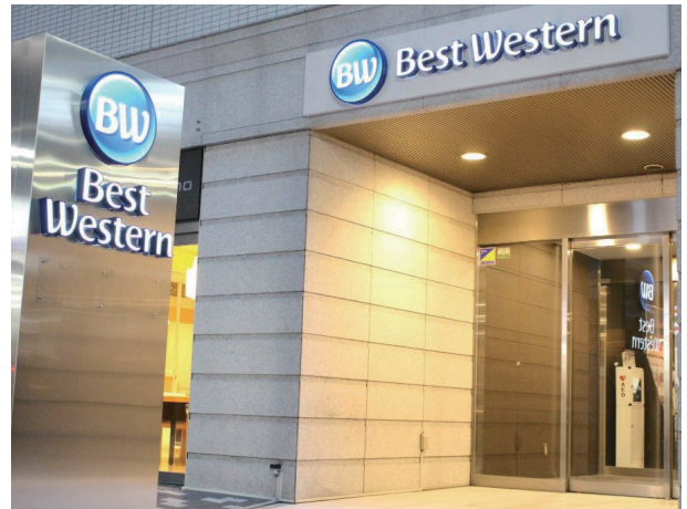
Best Western Osaka Hotel, Japan 日本大阪心齋橋西佳酒店