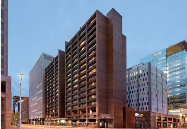
Sheraton Ottawa Hotel, Canada 加拿大渥太華喜來登酒店