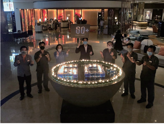
Earth Hour 地球一小時

Sheraton Saigon Hotel & Towers, Vietnam 越南胡志明市西貢喜來登酒店