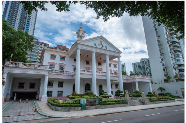
Ocean Club, Macau 澳門海洋會所