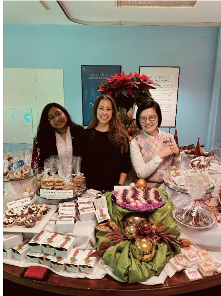
Bake Sale for SickKids Foundation 為病童籌款

Delta Hotels by Marriott Toronto Airport, Canada 加拿大多倫多機場會議中心 德爾塔萬豪酒店