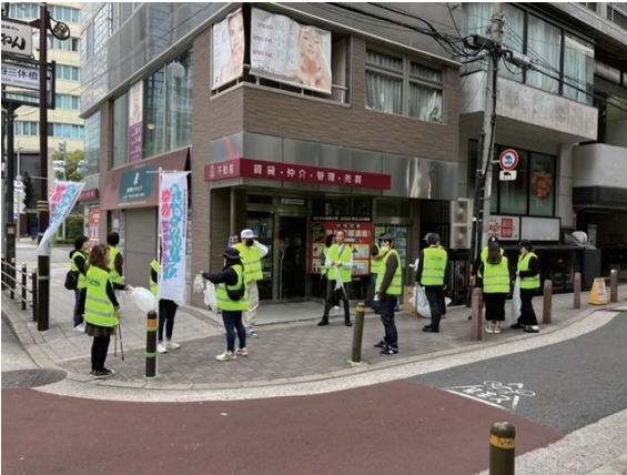
Street Cleaning 街道清潔

Best Western Hotel Fino Osaka, Japan 日本大阪心齋橋西佳酒店