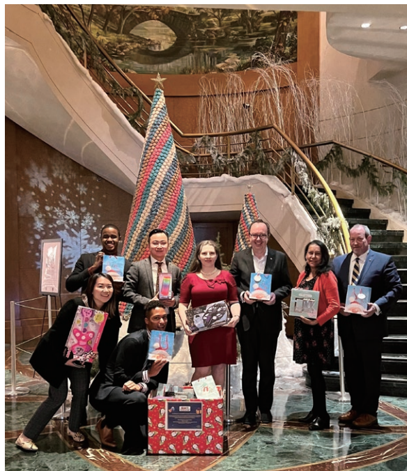
Toy drive 玩具慈善捐贈