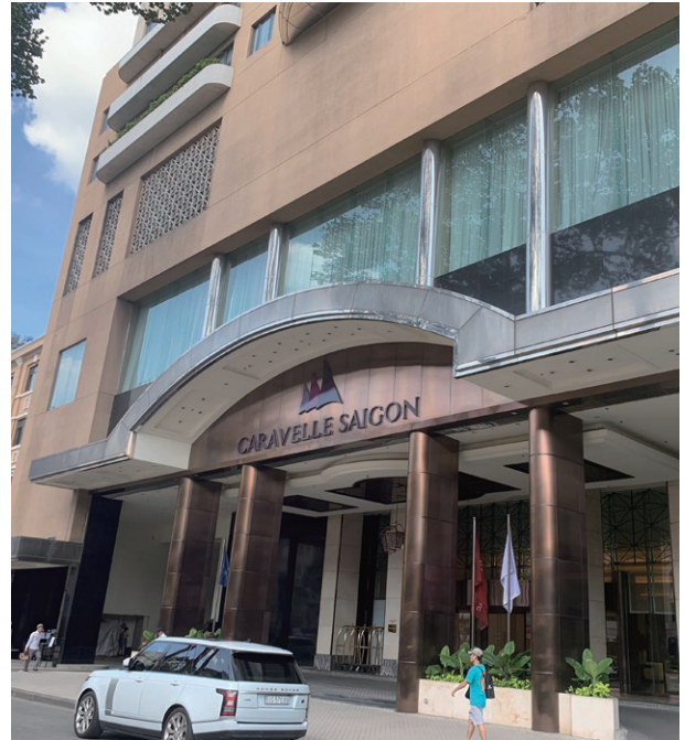
Caravelle Saigon Hotel, Vietnam 越南胡志明市帆船酒店