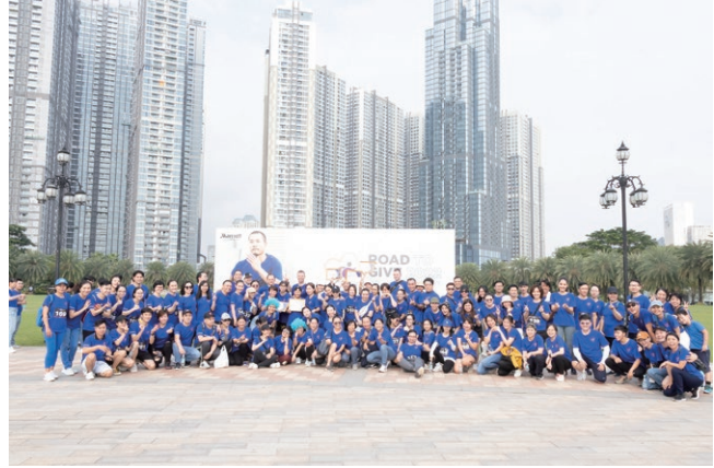
Marriott Road to Give 2022 二零二二萬豪慈善之路

Best Western Hotel Fino Osaka, Japan 日本大阪心齋橋西佳酒店