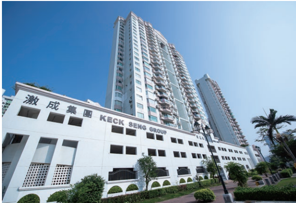
Ocean Gardens, Macau 澳門海洋花園