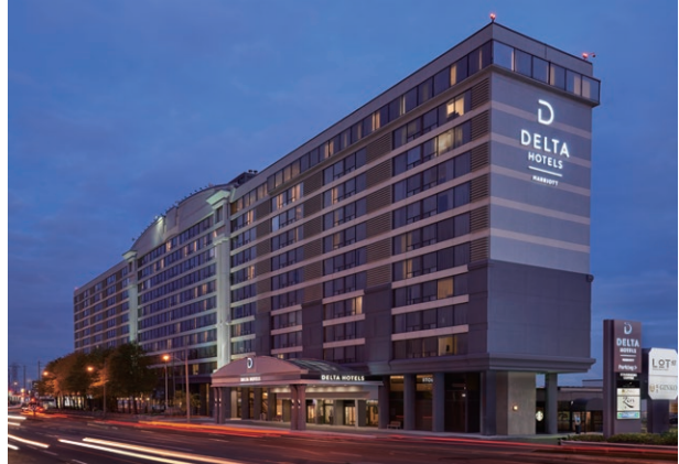
Delta Hotels by Marriott Toronto Airport & Conference Centre, Canada 加拿大多倫多機場會議中心德爾塔萬豪酒店