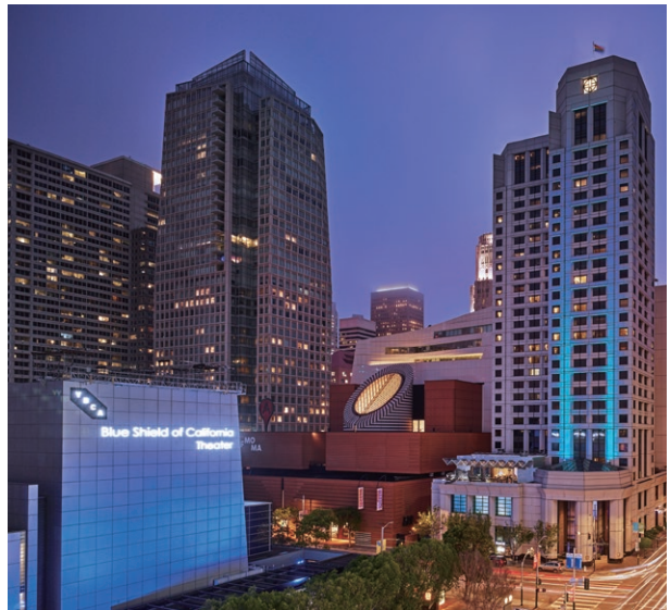
W Hotel San Francisco, USA 美國三藩市W酒店