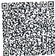
张建军年检二维码

本证书经检验合格, 继续有效一年。 This certificate is valid for another year after this renewal.