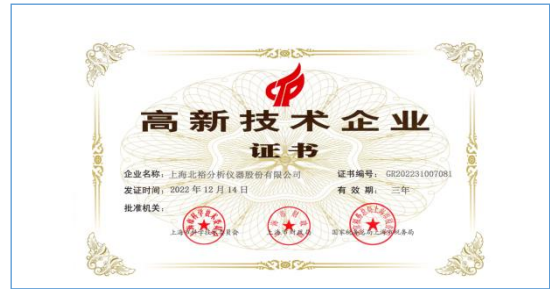
“国家高新技术企业”第四次认定通过