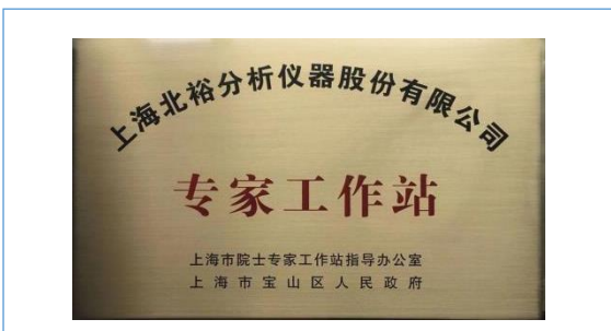
上海市专家工作站授牌