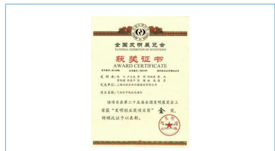
全国发明展“发明创业奖项目奖”金奖