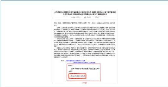
荣获“全国和谐劳动关系创建示范企业”