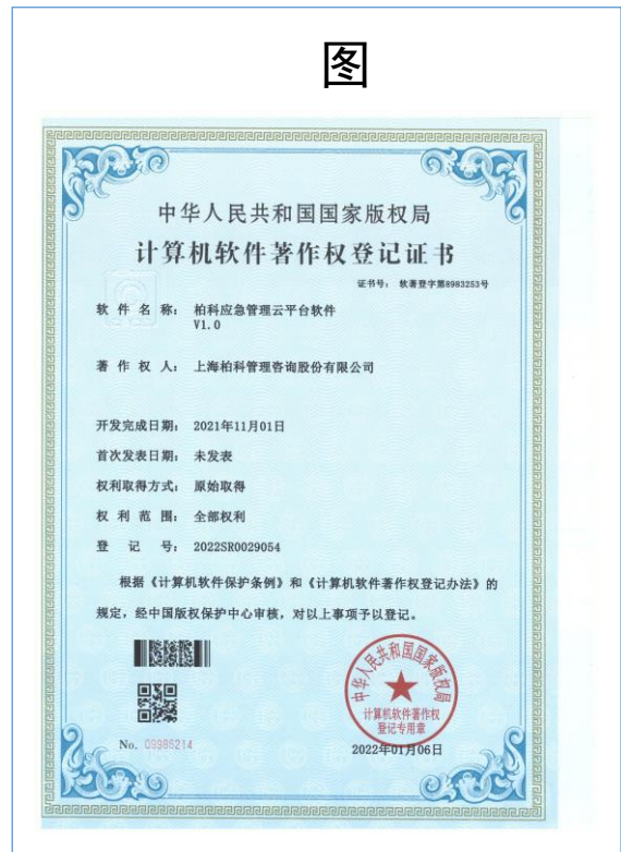
软件著作权证书：应急管理云平台软件