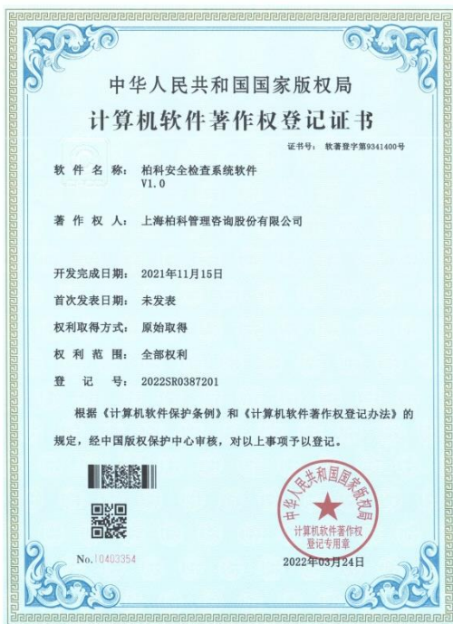
软件著作权证书：柏科安全检查系统软件