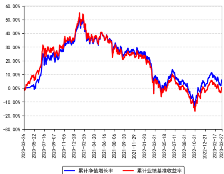
南方粤港澳大湾区创新100ETF发起联接A累计净值增长率与同期业绩比较基准收益率的历史走势对比图