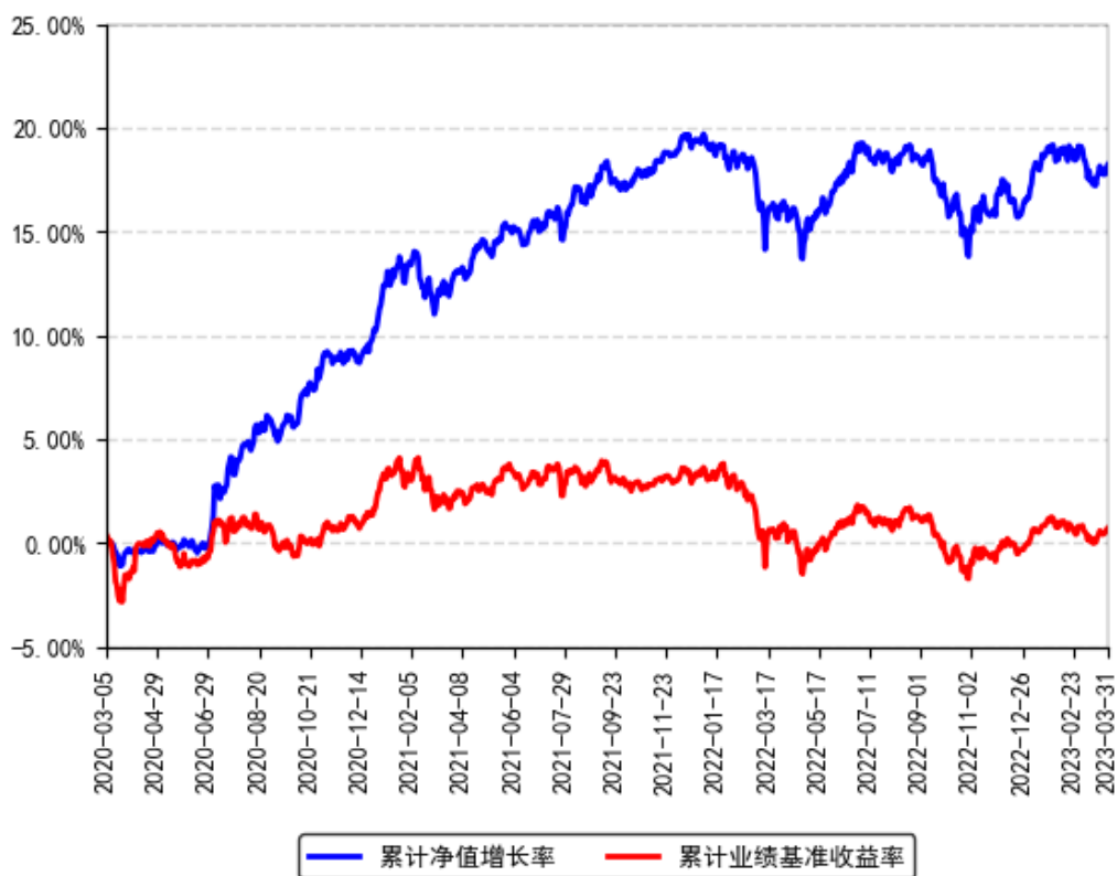
南方宝丰混合A累计净值增长率与同期业绩比较基准收益率的历史走势对比图