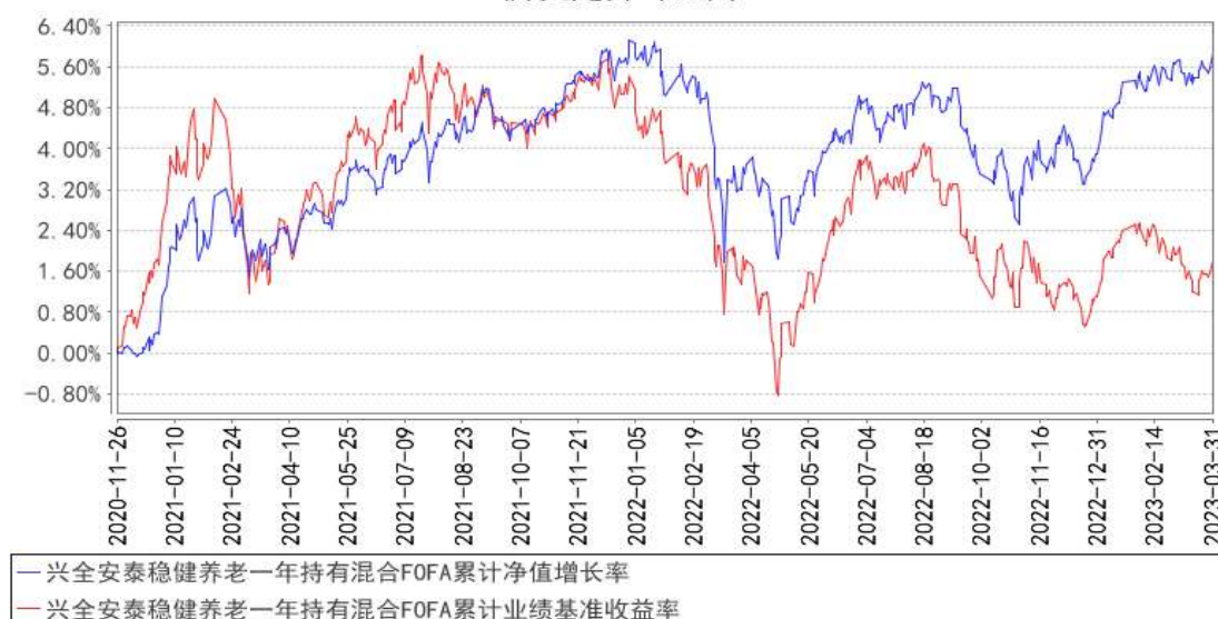
兴全安泰稳健养老一年持有混合FOFA累计净值增长率与同期业绩比较基准收益率的历史走势对比图