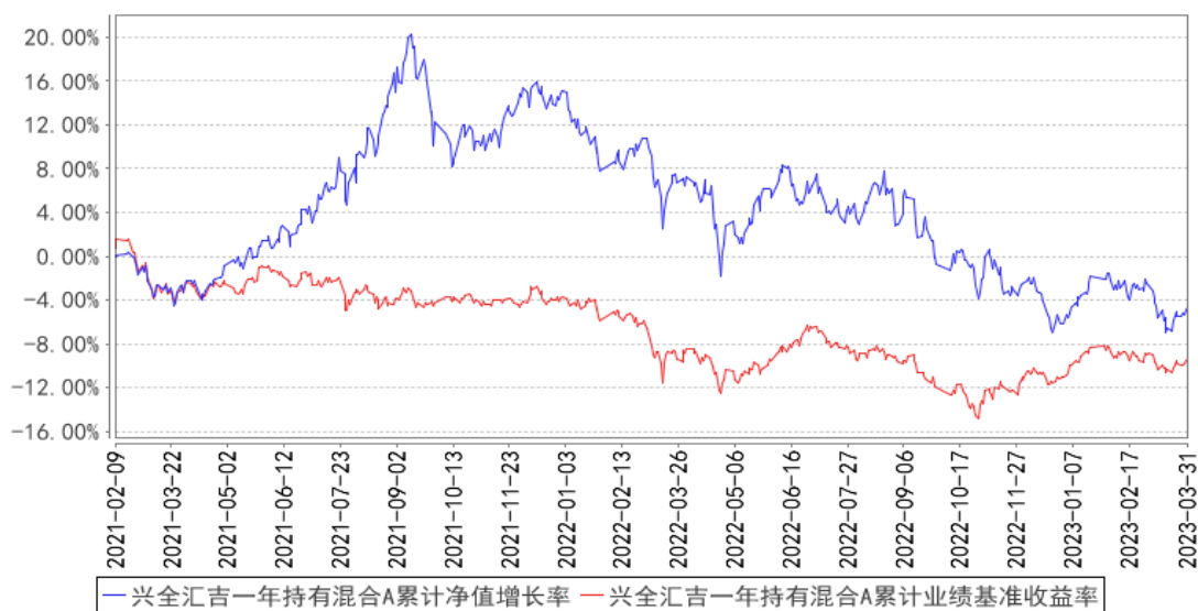
兴全汇吉一年持有混合A累计净值增长率与同期业绩比较基准收益率的历史走势对比图