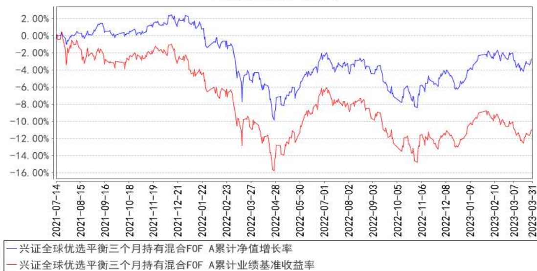
兴证全球优选平衡三个月持有混合 FOF A 累计净值增长率与同期业绩比较基准收益率的历史走势对比图