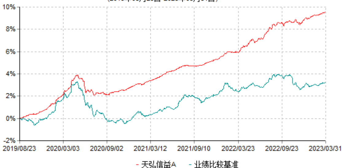
天弘信益A累计净值增长率与业绩比较基准收益率历史走势对比图 (2019年08月23日-2023年03月31日)