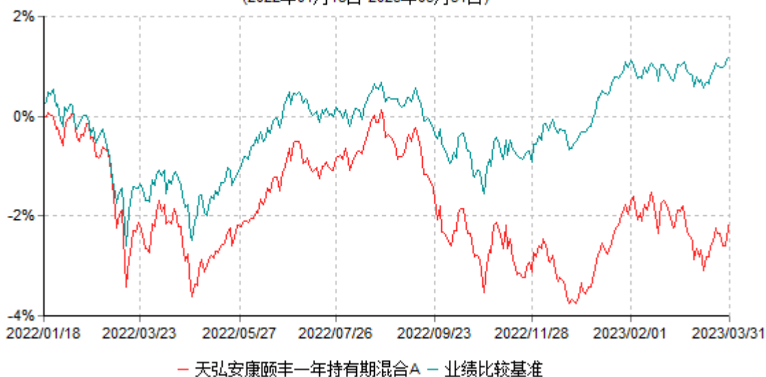
天弘安康颐丰一年持有期混合A累计净值增长率与业绩比较基准收益率历史走势对比图 (2022年01月18日-2023年03月31日)