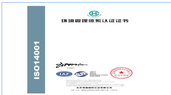
2022 年，取得 ISO14001 环境管理体系认证证书