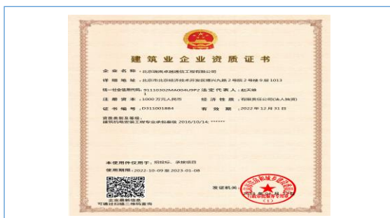
2022 年，子公司取得建筑机电安装工程专业承包叁级