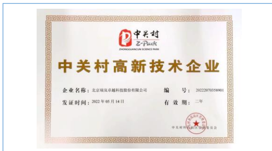
2022 年 5 月 14 日 取得中关村高新技术企业