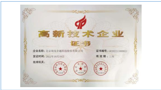
2022 年 10 月 18 日 取得高新技术企业证书