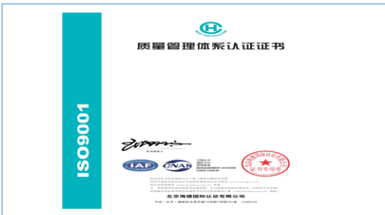
2022 年，取得 ISO9001 质量体系认证证书