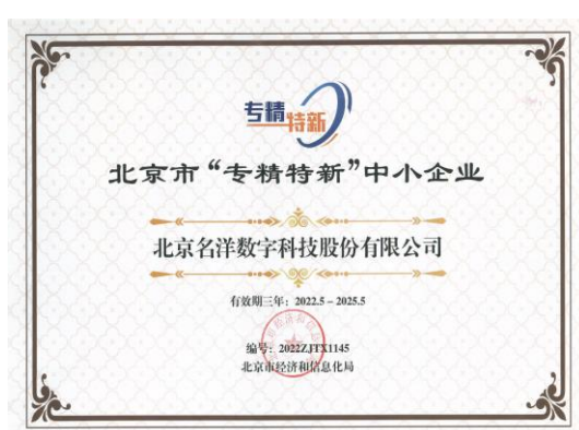
北京市“专精特新中小企业