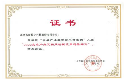
应用场景案例证书