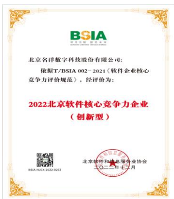
2022 北京软件核心竞争力企业（创新型）企业

2022 年 8 月，公司完成董监高换届选举、任命工作。公司将在第三届董监高相关人员的带领下，继续朝着大数据生产、治理、应用的创新者的行业定位快速发展。