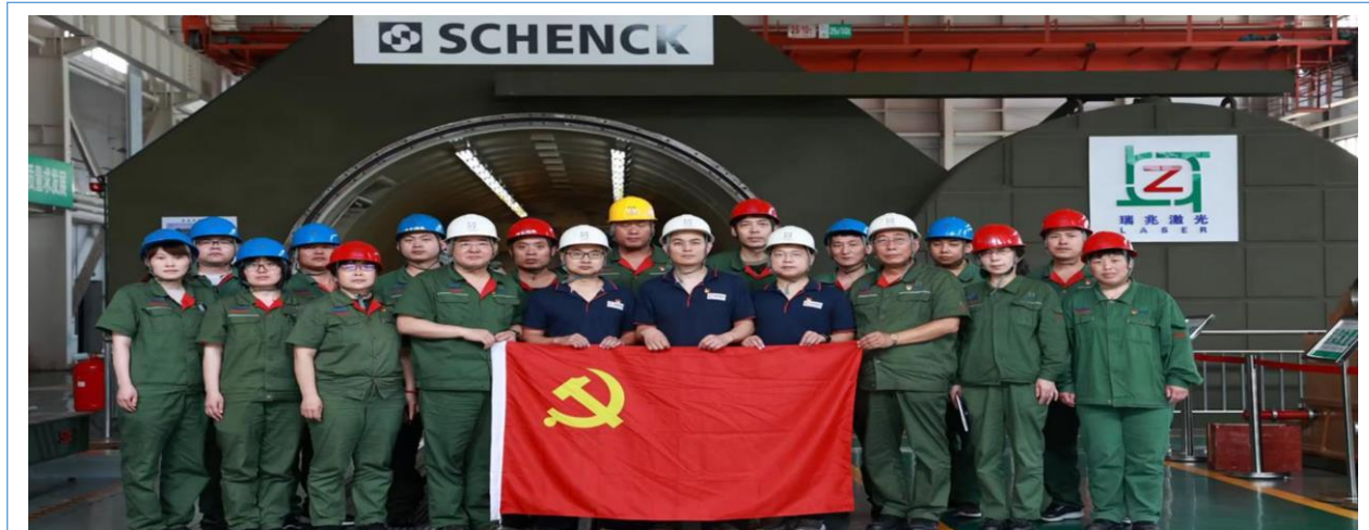
2022 年 6 月，国家管网燃气轮机动力涡轮托转实验取得圆满成功，实验数据优于国家标准，顺利通过专家验收，彻底打破国外技术封锁。