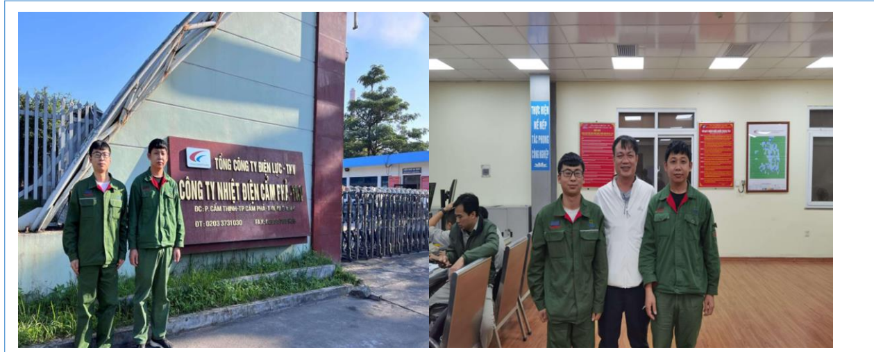
2022 年 11 月，公司拓展“一带一路”再制造服务市场，高质量服务越南锦普 340MW 汽轮发电机转子在线动平衡实验。