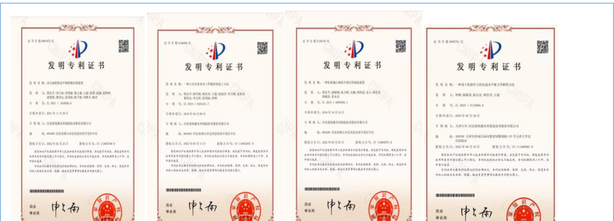
2022 年全年，公司取得 4 项发明专利，11 项实用新型专利。