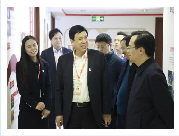
2022 年 3 月，河南省工信厅副厅长田海涛莅临中钢网总部参观指导