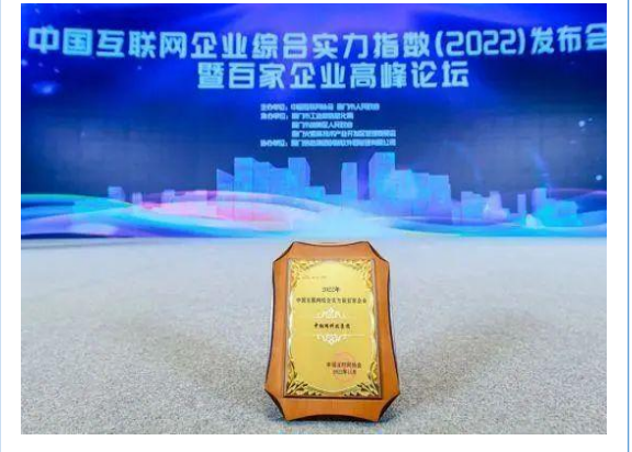
2022 年 11 月，中钢网第五次入选“中国互联网百强企业”