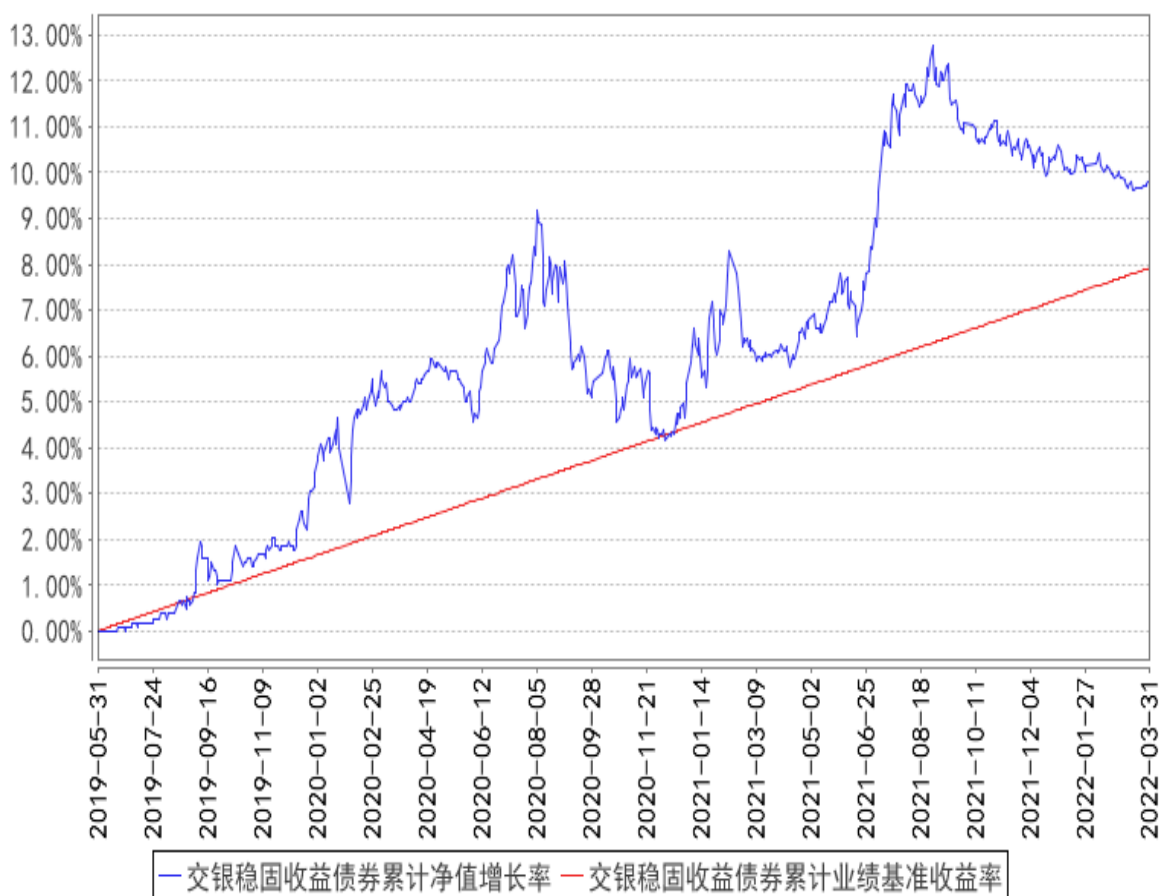
交银稳固收益债券累计净值增长率与同期业绩比较基准收益率的历史走势对比图

注：本基金由交银施罗德荣祥保本混合型证券投资基金转型而来。基金转型日为2019年5月31日。本基金的投资转型期为交银施罗德荣祥保本混合型证券投资基金保本周期到期选择期截止日次日（即2019年5月31日）起的3个月。截至投资转型期结束，本基金各项资产配置比例符合基金合同及招募说明书有关投资比例的约定。