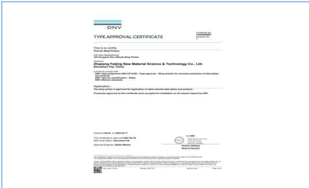
2022年2月，获得GL德国劳氏证书（续证）。