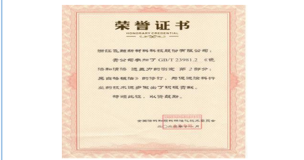
2022年11月，获得国家标准的GB/T 23981.2《色漆和清漆遮盖力的测定 第2部分: 黑白格板法》的修订证书。