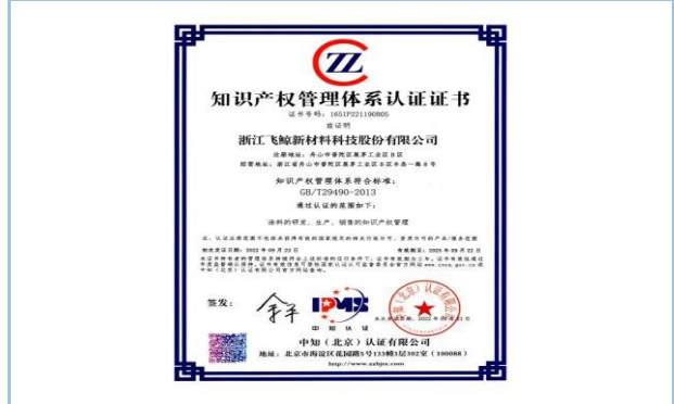
2022年9月，获得知识产权管理体系认证证书。