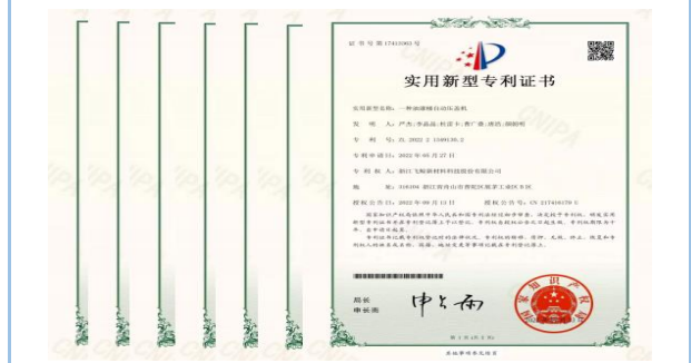
2022年8月至11月，获得“一种油漆桶自动压盖机”等7项实用新型专利。