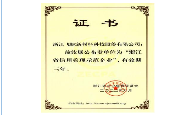
2022年8月，获“浙江省信用管理示范企业”证书（复评）。