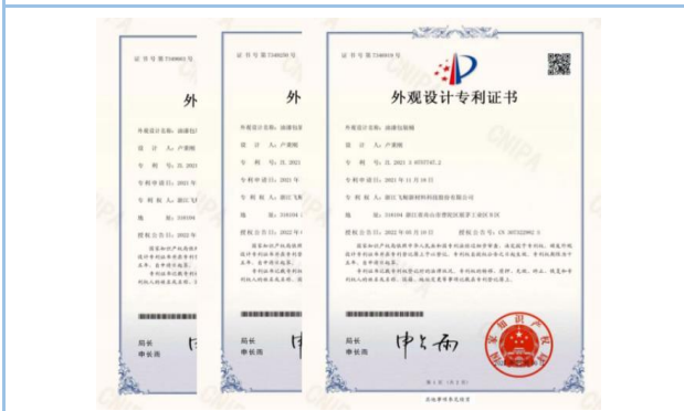
2022年5月，获得外观设计专利3项，外观设计名称：油漆包装桶。