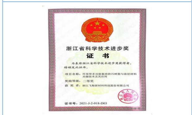
2022年6月，“环保型多功能氟硅防污树脂与涂层材料关键技术及其应用”项目获浙江省科学技术进步奖二等奖。