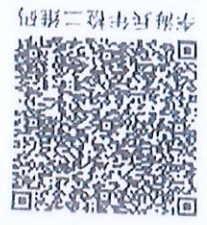
李海兵年检二维码

本证书经检验合格，继续有效一年。 This certificate is valid for another year after this renewal.