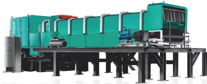
PIDS光电智能干式选煤机 Photoelectric Intelligent Dry Type Coal Separator

智能矿石分选装备主要用于对煤炭、有色金属、非有色金属等矿石的分级分选。目前公司已研发出应用于煤炭分选的智能干式煤炭分选装备，是一种可以利用 X 射线结合可见光多谱段扫描成像系统采集传送带上物料的图像，通过深度学习图像识别技术对图像进行目标检测和分类，准确控制高压风对矸石、杂质进行喷吹，实现精确、高效、节能的全自动煤炭分选的装备，该产品具有可替代人工手选和跳汰机，降低水资源污染、减少煤泥产生、提高单位煤的热值，助力煤炭企业清洁、高效开采，降低煤炭分选成本等优点。