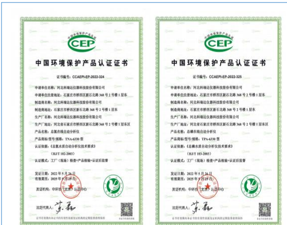
2022年6月取得两款中国环境保护产品认证证书