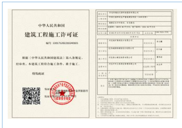
2022年10月取得环保仪器研发生产基地建设项目的建筑工程施工许可证