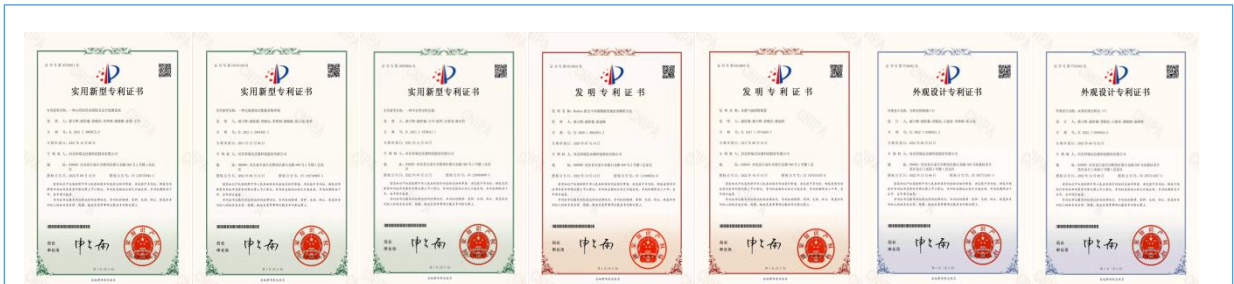
2022年取得3项实用新型专利证书，2项发明专利证书，2项外观设计证书