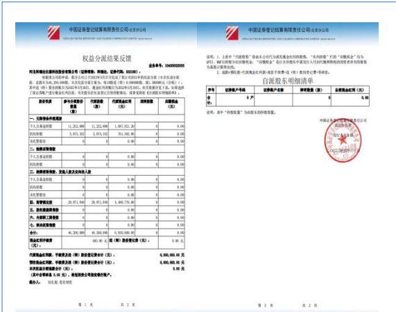
2022年5月完成现金红利的权益分派