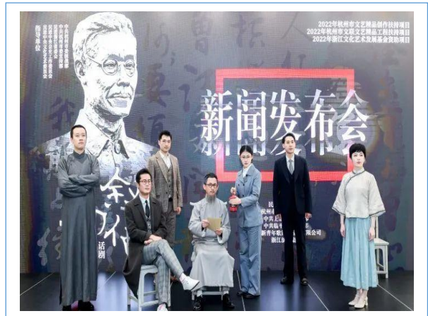
原创话剧《马叙伦》新闻发布会在杭州举行