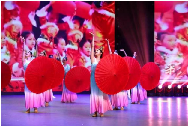
“新青年”圆满完成“文化润疆”任务