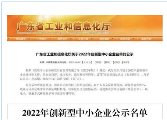
入选广东省2022年创新型中小企业