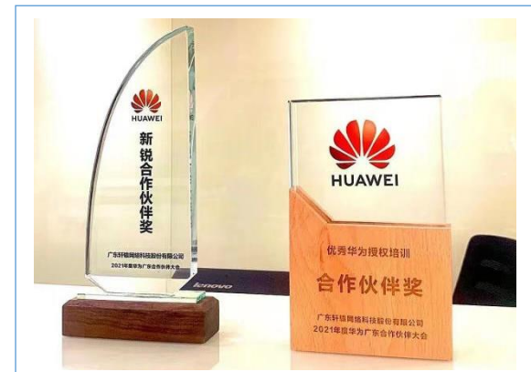
获“优秀华为授权培训合作伙伴奖”、“新锐合作伙伴奖”