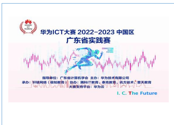
承办华为 ICT 大赛 2022-2023 中国区广东省实践赛