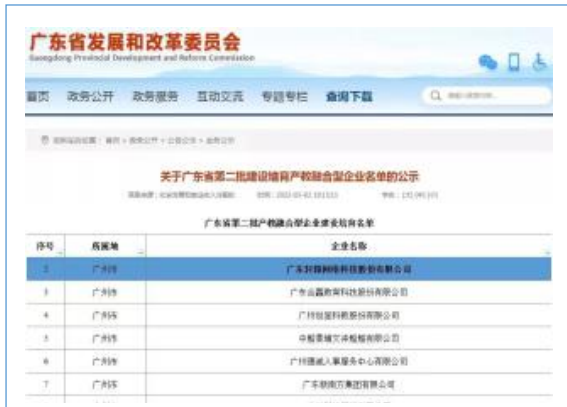
入选广东省第二批产教融合型企业建设培育名单