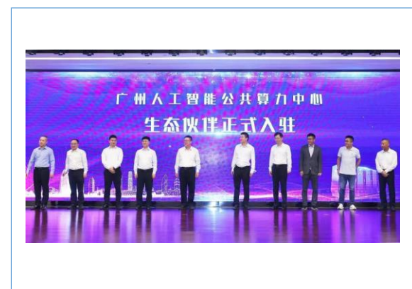
作为生态合作伙伴入驻广州人工智能公共算力中心