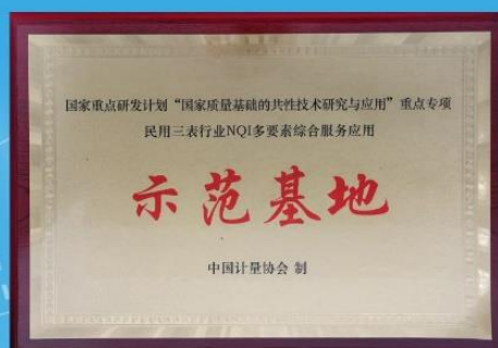
公司获评国家重点研发计划示范基地