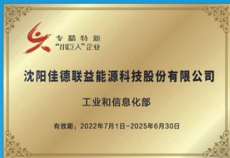
公司荣获国家级专精特新“小巨人”企业称号