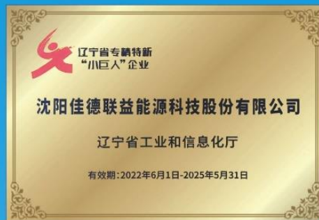
公司荣获辽宁省专精特新“小巨人”企业称号