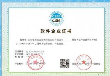
公司获评2022年辽宁省软件企业