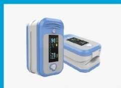
温度和脉搏血氧仪