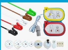
心电电极及导联线