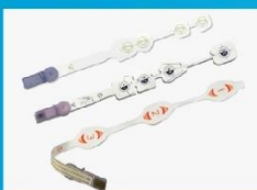
一次性无创脑电传感器