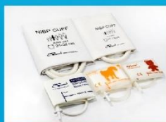
新生儿一次性袖带