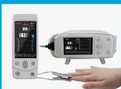
掌式和台式血氧仪