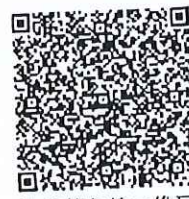
徐俊伟年检二维码

本证书经检验合格，继续有效一年。 This certificate is valid for another year after this renewal.