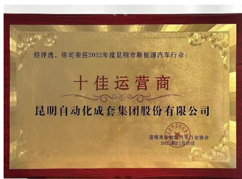
2022年12月，昆自集团获“昆明市新能源汽车行业协会”颁发的“十佳运营商奖”