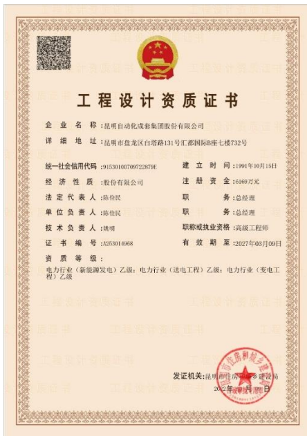
2022年3月，昆自集团获得电力行业 新能源发电乙级资质