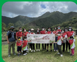
參與基督教香港信義會恩青營的植樹活動