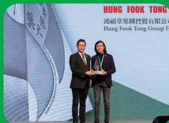
榮獲「2021年香港環境卓越大獎：商舖及零售業－銀獎」