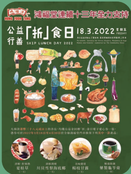
連續十三年贊助公益行善「折」食日