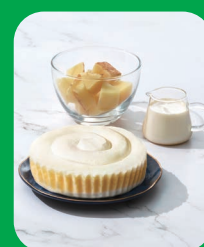
鴻福堂café概念店「HFT Life」推出日本直送蛋糕及甜品，以及新鮮烤焗蛋撻、酥餅