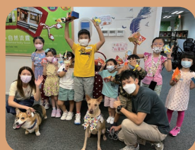
優化多項家庭友善措施，提升員工幸福感