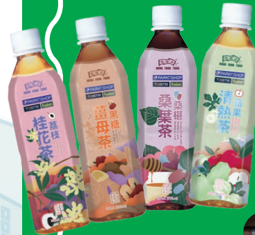
鴻福堂x百佳超級市場多款新口味聯乘樽飲登場