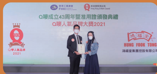
再獲香港工業總會頒發「Q嘜人氣品牌大獎」