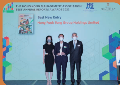
榮獲香港管理專業協會2022年「最佳年報獎」兩個獎項