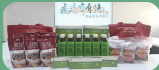
向社會各界捐贈抗疫包及清肺解毒飲