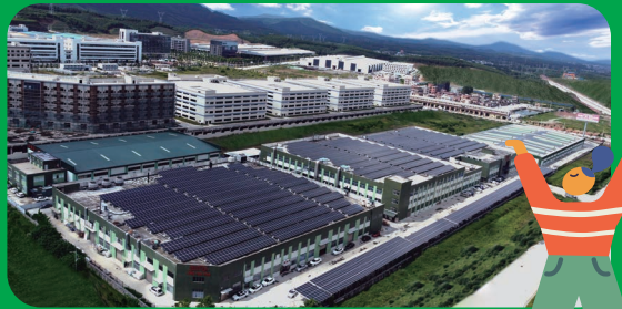
於開平廠房完成鋪設太陽能系統