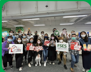
聯同多間社企舉辦員工市集，推廣可持續及綠色生活