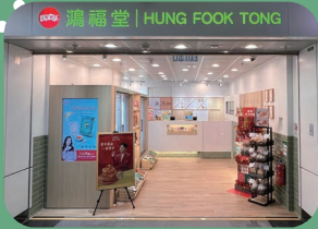
於港鐵紅磡站、香港科學園開新店