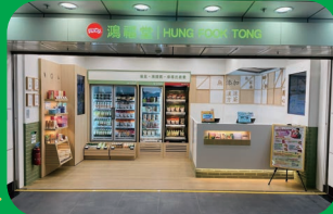
港鐵會展站新店開張