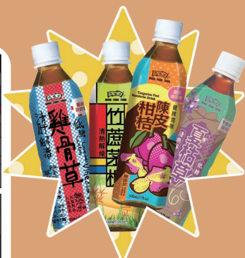
推出「藝術這回事」特別版樽飲