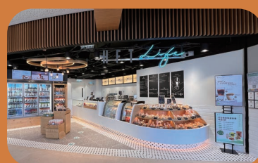
於香港科技大學開設HFT Life