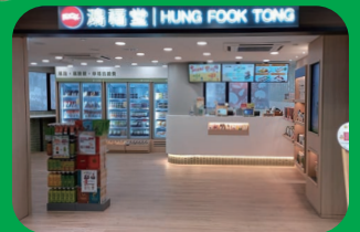
利東商場新店開張