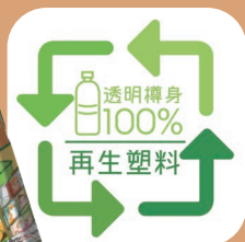
部份飲品樽身採用再生塑料，減少碳排放