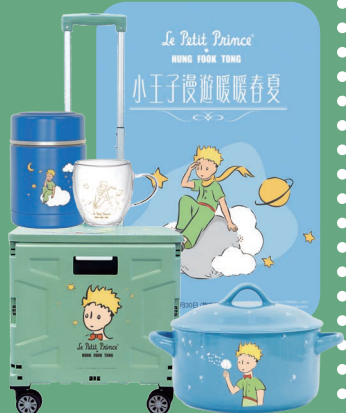
推出多款鴻福堂X Le Petit Prince® 小王子廚具精品