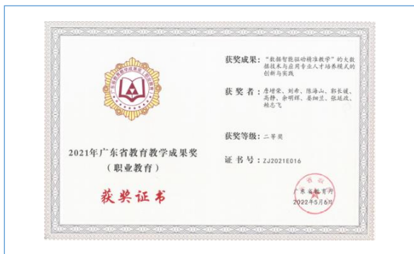
2022 年 5 月，荣获广东省教育厅“2021 年广东省教育教学成果奖（职业教育）二等奖”