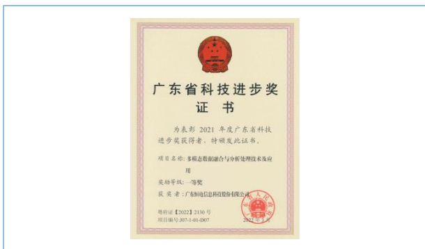
2022 年 3 月，荣获“广东省科技进步奖一等奖”