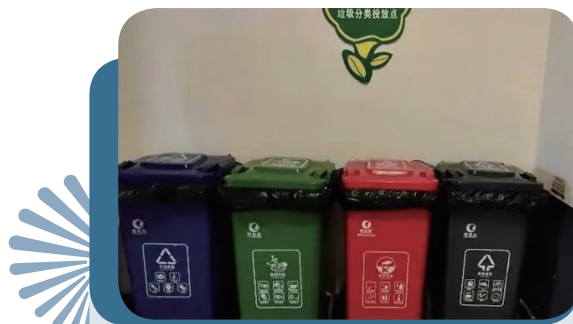
本集團辦公室內的生活垃圾分類回收箱