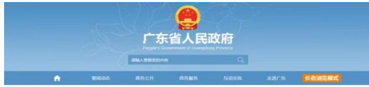
2021 年度广东省科学技术奖获奖名单