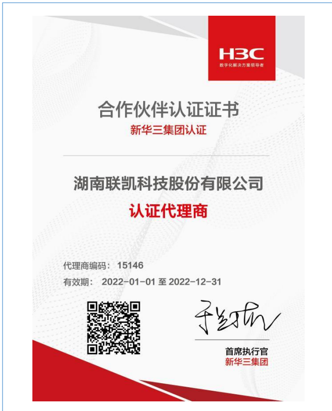
2022 年取得新华三集团合作伙伴认证代理商证书