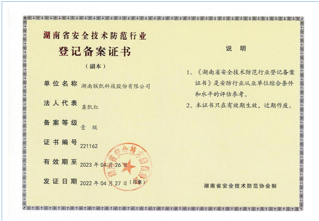
2022 年 4 月取得湖南省安全技术防范行业壹级证书