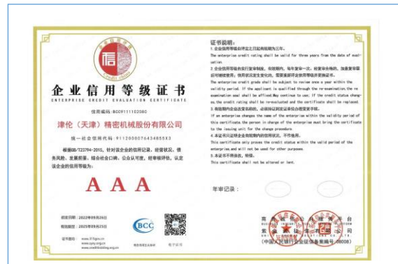
2022年度获得企业信用等级AAA