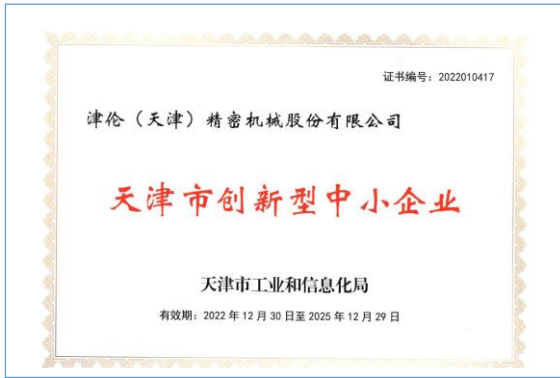
2022年度获得天津市创新型中小企业