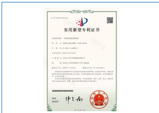
实用新型专利：一种水稻恒温浸种装置