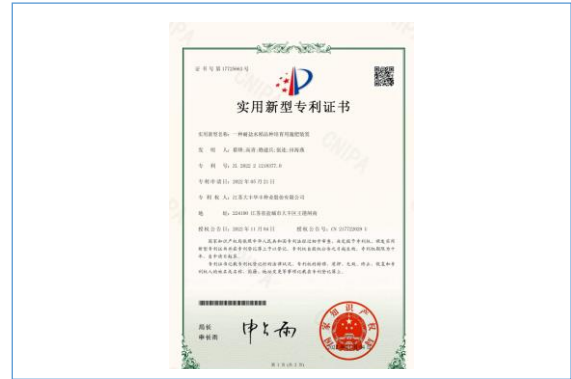
实用新型专利：一种耐盐水稻品种培育用施肥装置