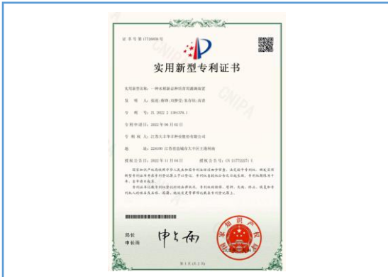
实用新型专利：一种水稻新品种培育用灌溉装置