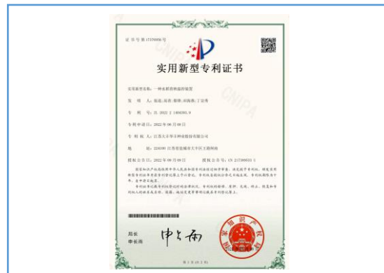
实用新型专利：一种水稻育秧温控装置