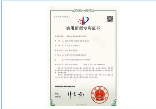
实用新型专利：一种耐盐水稻品种苗情监控装置