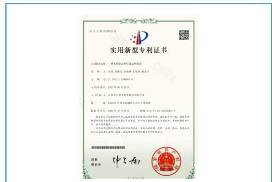
实用新型专利：一种水稻新品种培育选种装置