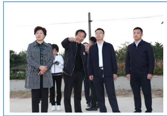
盐城市大丰区区长戴勇来华丰种业调研