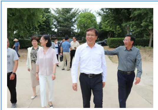
江苏省农业农村厅一级巡视员唐明珍来华丰种业调研