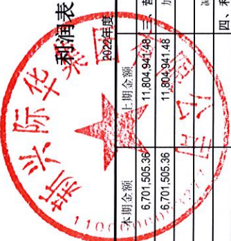
企财02表 金额单位：元